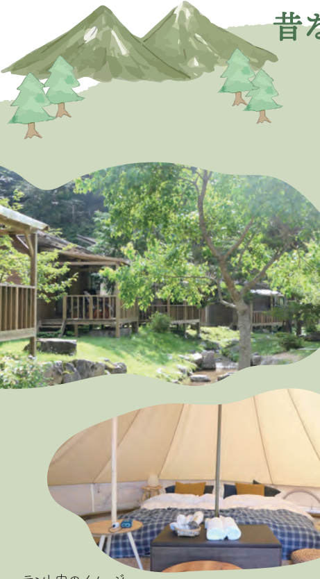
テント内のイメージ